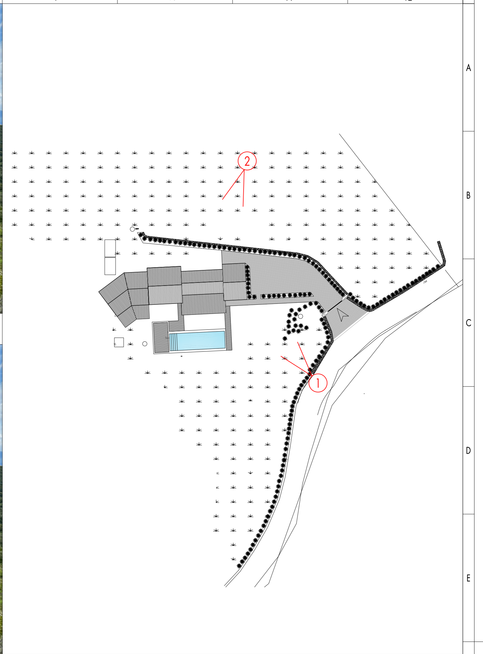
FOTO 1 - FOTOSIMULAZIONE AUTORIZZATA DCPU 383/2017