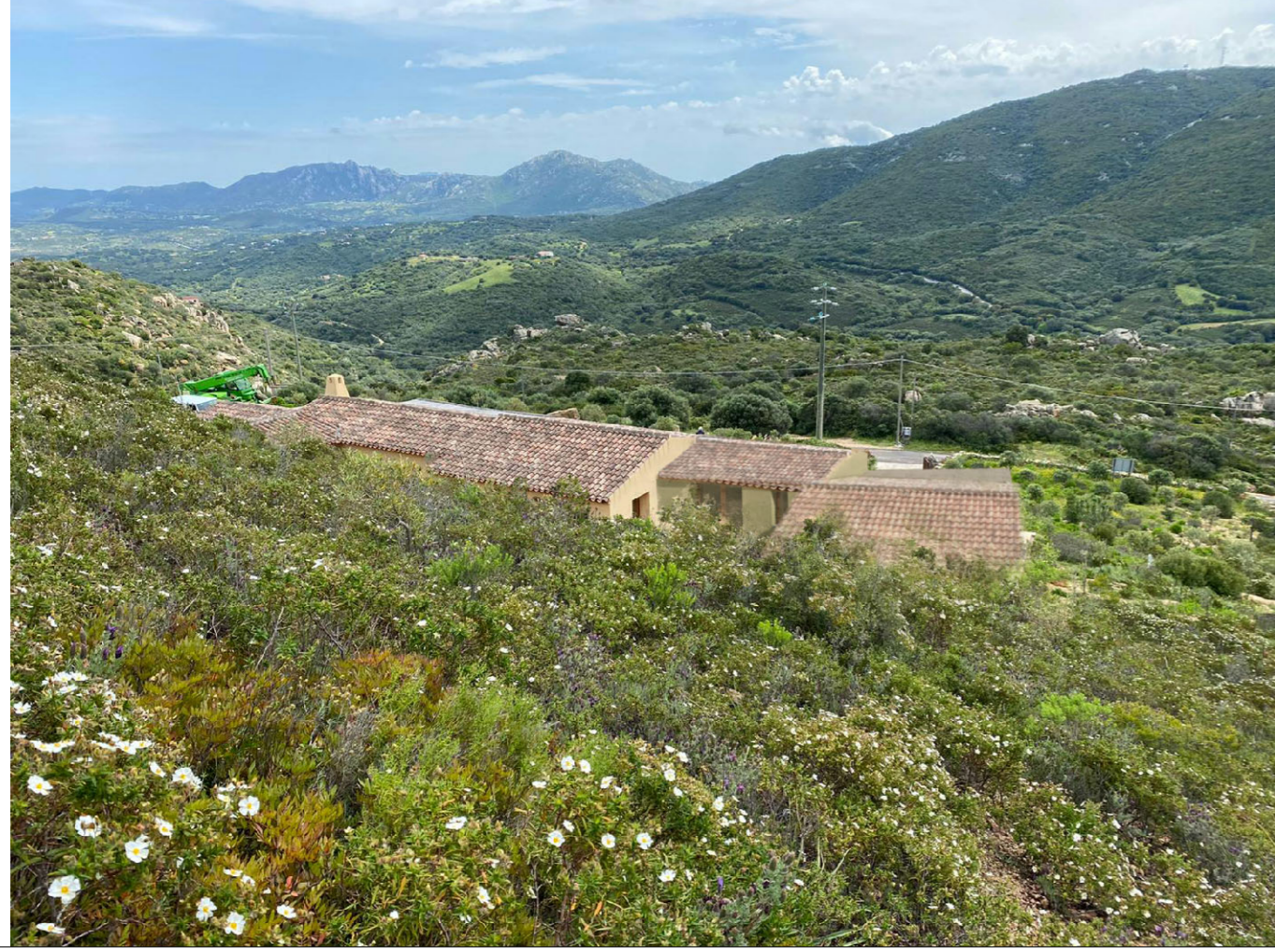
FOTO 1 - FOTOSIMULAZIONE PROGETTO