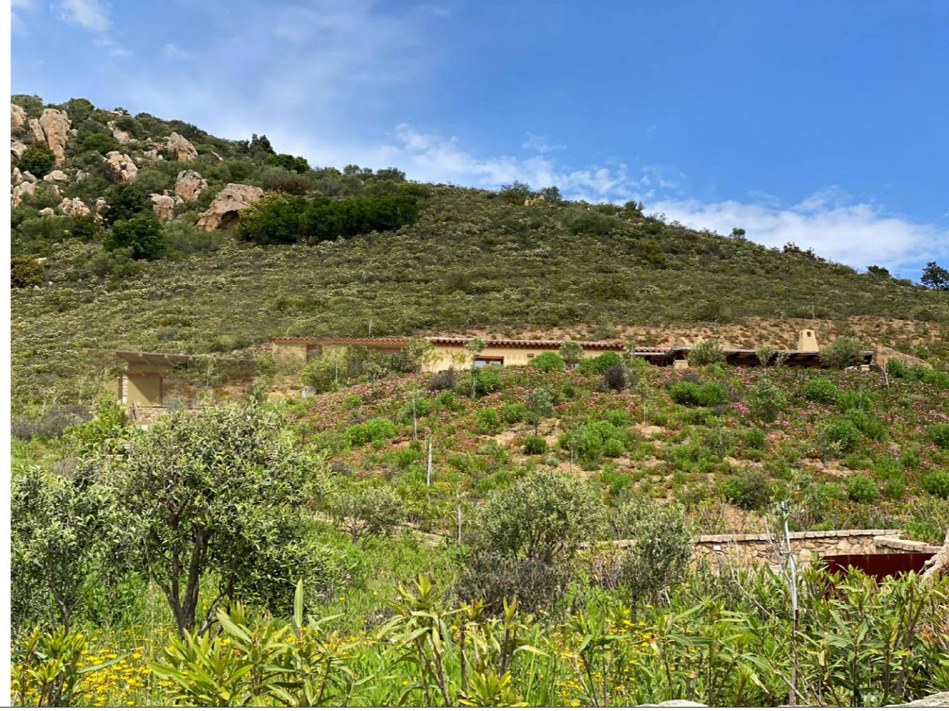
FOTO 2 - FOTOSIMULAZIONE PROGETTO